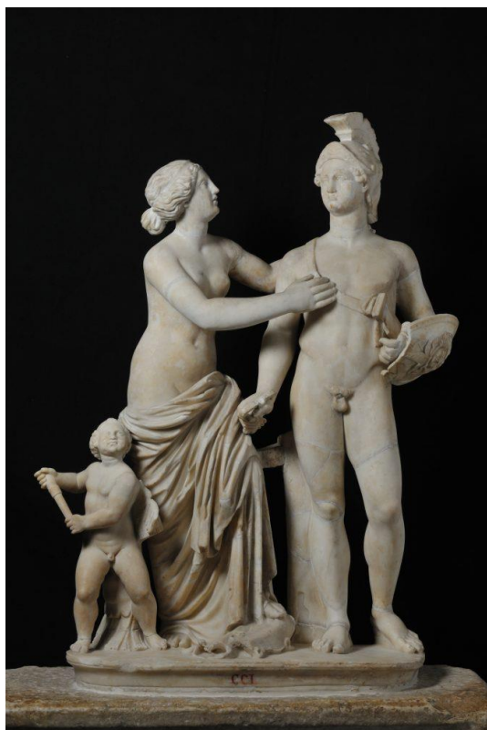
Venere, Marte e Cupido, Roma, Galleria Borghese

Tempo: 4 ore È consentito l'uso del vocabolario della lingua italiana e del vocabolario latino-italiano.