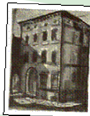
Liceo Classico Minghetti

AICC Associazione Italiana di Cultura Classica Fondata nel 1897